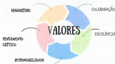
Fig. 1 - Valores

O Agrupamento valoriza cada aluno como um Ser Humano Único, promovendo o respeito pelos Direitos Humanos, bem como o espírito de partilha, solidariedade e entreatajuda. Assim, assenta em valores como: