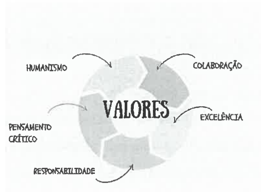
Fig. 1 - Valores

O Agrupamento valoriza cada aluno como um Ser Humano Único, promovendo o respeito pelos Direitos Humanos, bem como o espírito de partilha, solidariedade e entajuda. Assim, assenta em valores como: