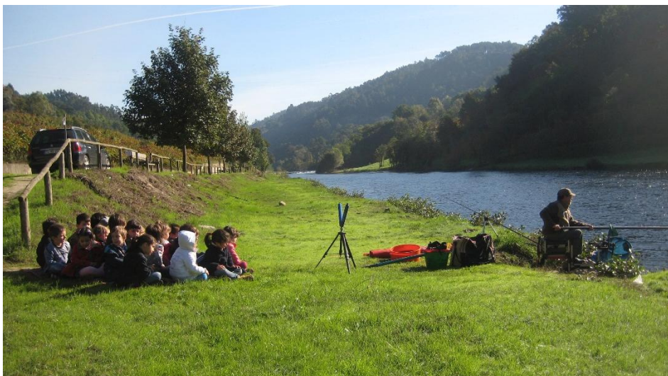
1 – As crianças observam como se procede à Pesca.