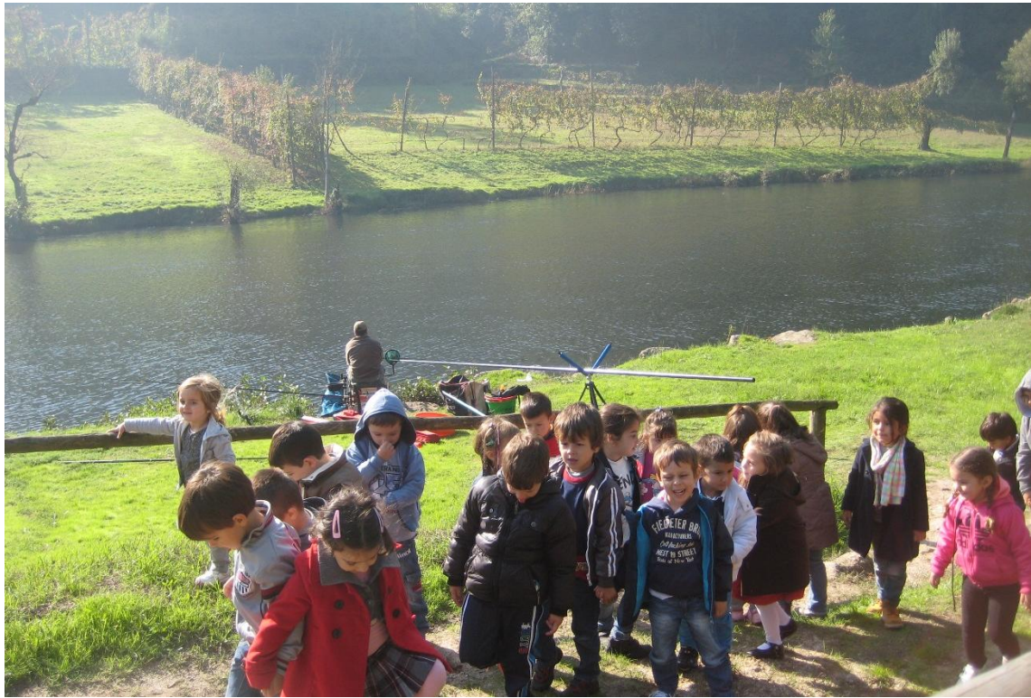
4 – Regresso a escola. Para trás fica uma linda paisagem a preservar, a cuidar... na freguesia de Cavez.